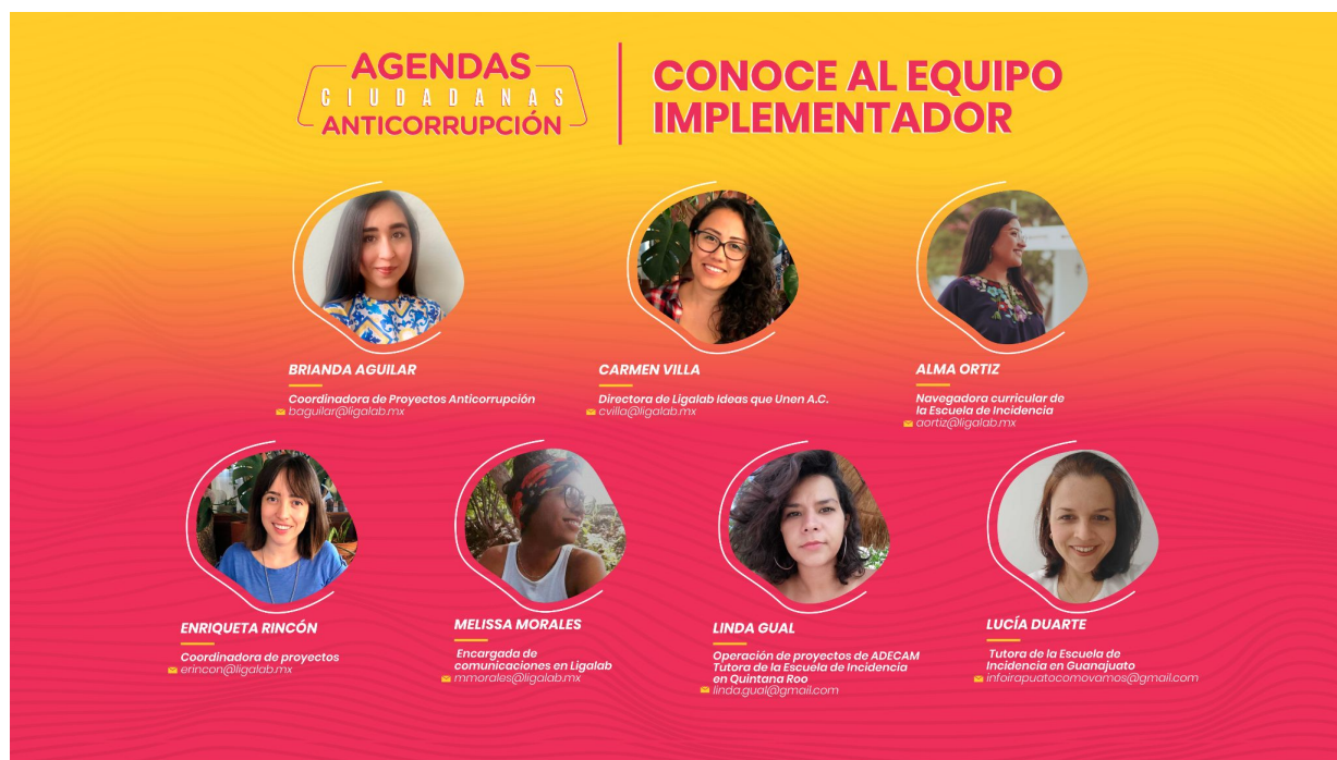
Gráfico 1. Organigrama equipo implementador.

Lo anterior, forma parte de las acciones para prevenir y hacer frente a la corrupción en Guanajuato que se establecieron en el marco del proyecto Cocreación Local de Agendas Ciudadanas Anticorrupción. En este cuadernillo se presenta la estrategia implementada para considerar la perspectiva social local en el combate a la corrupción a través de ejercicios colaborativos entre la sociedad civil, instituciones públicas y la ciudadanía en general: los momentos que lo conformaron, logros, retos y estrategias; así como sus compromisos con el combate a la corrupción.