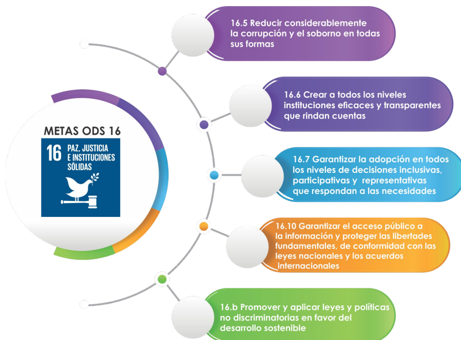
Gráfico 10. Metas de los ODS a los que se alinea la Agenda Ciudadana Anticorrupción.

Parte de la ruta de incidencia anticorrupción es el seguimiento, análisis y adecuación de las acciones de las organizaciones firmantes al Programa de Implementación de la PEA en Guanajuato, este fue presentado a finales de 2021.