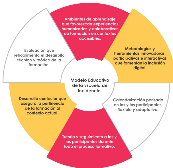
Gráfico 5. Modelo Educativo de la Escuela de Incidencia.

El proceso formativo estuvo fundamentado en el enfoque constructivista del aprendizaje propuesto por Lev Vigotsky (1978), en donde la persona y sus aspectos cognitivos, sociales y afectivos son una construcción propia que se produce como resultado de la interacción con el ambiente. A partir de esa relación el/la estudiante construye el conocimiento con los esquemas que ya posee. La EdI, entonces, promovió la construcción y adquisición de conocimientos usando estrategias de aprendizaje asociativas del contexto, de motivación en el proceso, de cooperación entre pares y de práctica, en conjunción de las estrategias de enseñanza tales como el uso de analogías, recursos visuales y preguntas intercaladas que fueron diseñadas por el equipo implementador de la mano de las personas expertas en el tema anticorrupción.