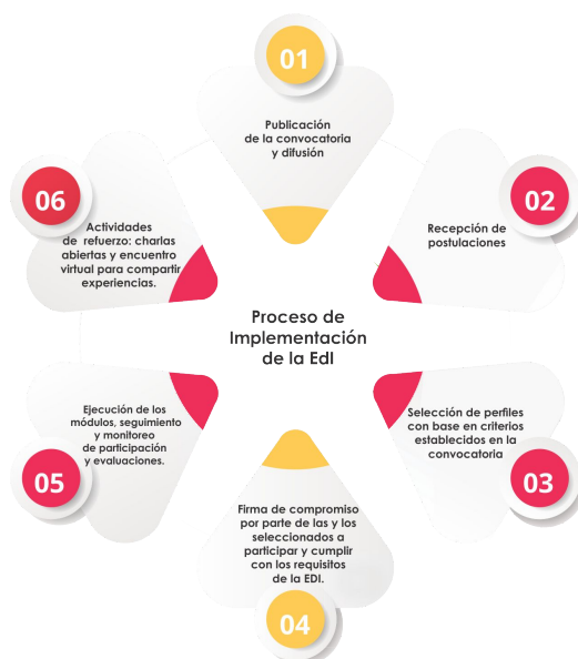
Gráfico 4. Proceso de implementación EdI.

Para el funcionamiento de la EdI, en múltiples contextos, es importante considerar el proceso de adaptación que se describe en las siguientes páginas así como la estrategia para su implementación.