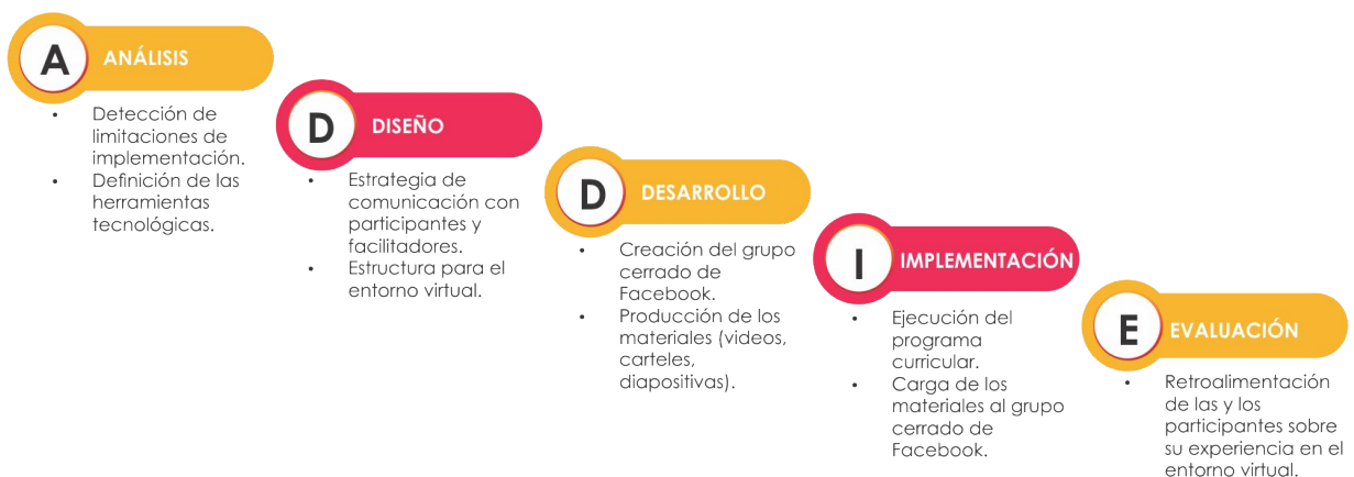
Gráfico 6. Modelo ADDIE utilizado para la planificación pedagógica.

Debido a la naturaleza virtual del modelo educativo, este contó con un diseño instruccional que ayudó a planear y programar la enseñanza. Utilizando las cinco fases que caracterizan el diseño instruccional ADDIE 10 , se decidió albergar la EdI en un grupo cerrado de aprendizaje social en la plataforma Facebook de forma que esta tuviera la información organizada y sistematizada, facilitando la apropiación del entorno virtual. Con esto, las y los participantes potenciaron el aprendizaje interactivo, colaborativo, flexible y accesible a pesar de las distintas posibilidades de horarios y recursos tecnológicos disponibles para participar.