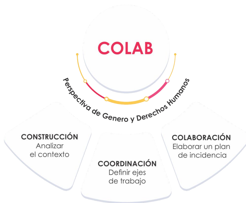
Gráfico 8. Diseño del Colab.

En este espacio de co-construcción, coordinación y colaboración, la sociedad civil analizó el contexto, definió ejes de trabajo y elaboró un plan de incidencia para ampliar el impacto de sus acciones y liderazgos locales, desde una perspectiva de género, derechos humanos, colaborativa e inclusiva.