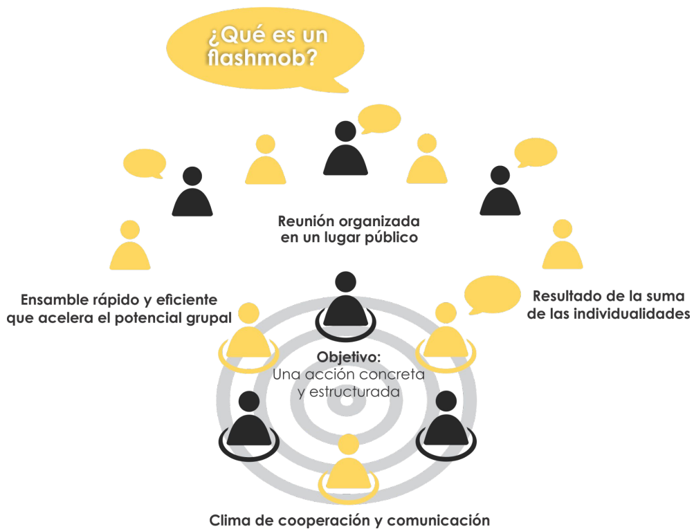
Gráfico 9. ¿Qué es un Flash-mob?

Para lograr el objetivo de la segunda sesión, integrantes del colectivo Método Ché, co-facilitaron la sesión de manera remota desde Argentina, dando seguimiento a los trabajos de la sesión uno del CoLab. En este ejercicio, el colectivo involucró técnicas pedagógicas análogas y digitales que permitieron definir las acciones anticorrupción componentes de la agenda, utilizando elementos para la innovación pública, bajo la metáfora de flash-mob.